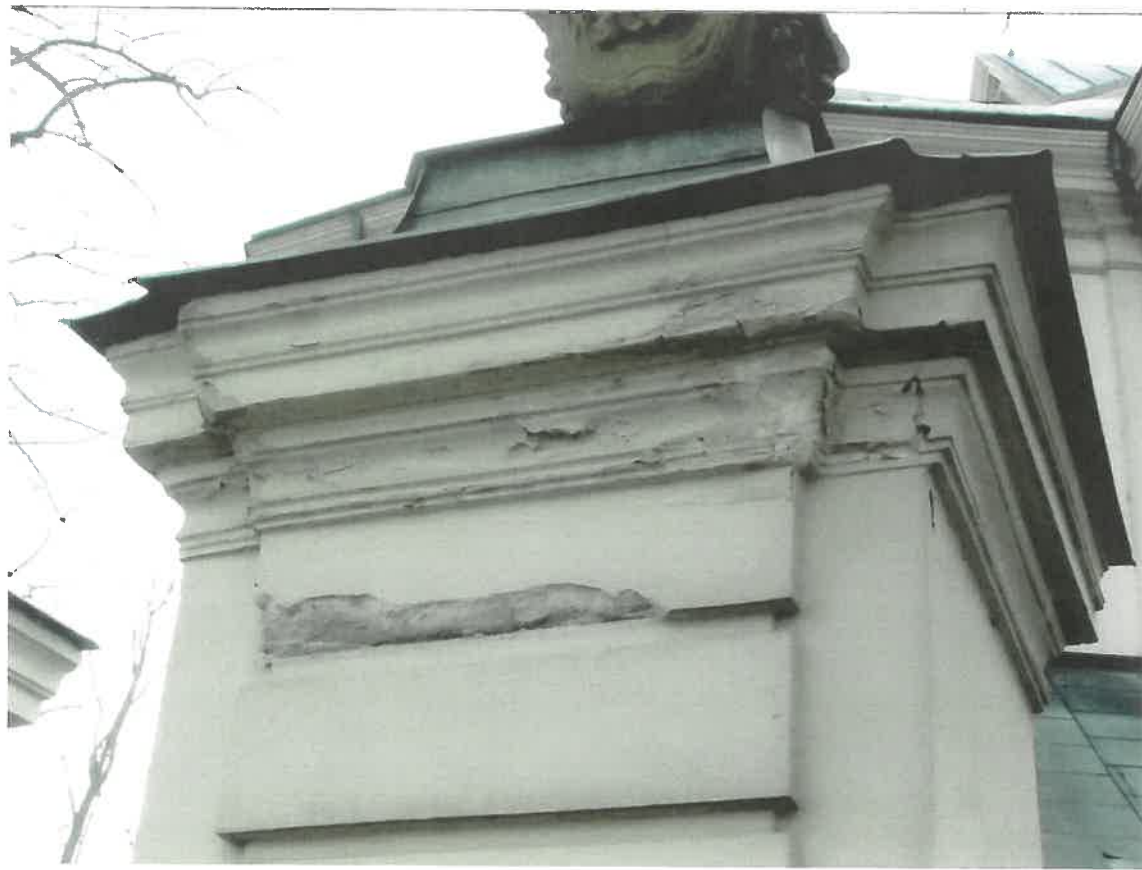
Fot.6 Kościół parafialny p.w. św. Marii Magdaleny w Dukli, II poł. XVIII w. Zwieńczenie jednego ze słupów ogrodzenia. Widoczny ubytek tynku na boniowaniu, a na gzymsie przetarcia, zruszczenia i ubytki farby. Grudzień 2023 r.