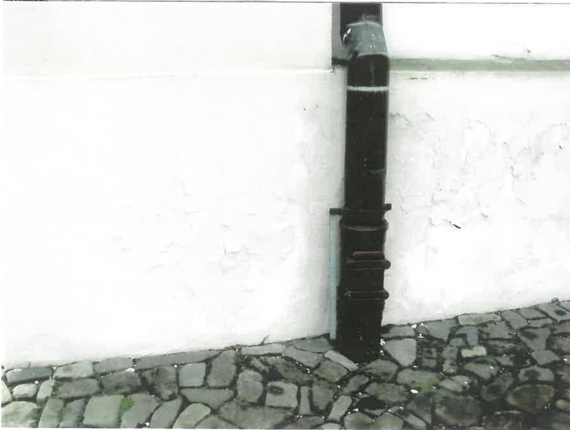
Fot.5 Kościół parafialny p.w. św. Marii Magdaleny w Dukli, II poł. XVIII w. Dolna część południowej elewacji kościoła. Widoczne liczne przetarcia, zruszczenia i ubytki farby. Grudzień 2023 r.