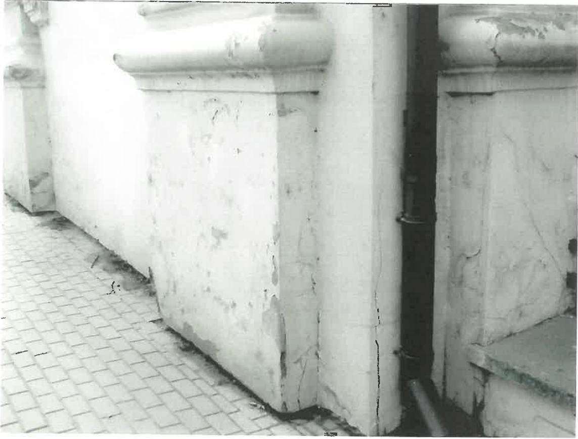
Fot.4 Kościół parafialny p.w. św. Marii Magdaleny w Dukli, II poł. XVIII w. Dolna część pilastrów w narożu północno-wschodnim elewacji dzwonnicy. Widoczne pęknięcia tynku oraz liczne przetarcia i ubytki farby. Grudzień 2023 r.