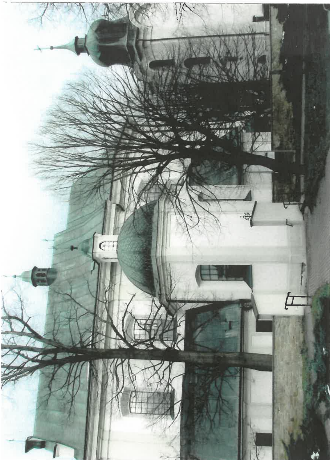
Fot.1 Kościół parafialny p.w. św. Marii Magdaleny w Dukli, II poł. XVIII w. Widok na kościół i dzwonnice od strony południowej. Grudzień 2023 r.