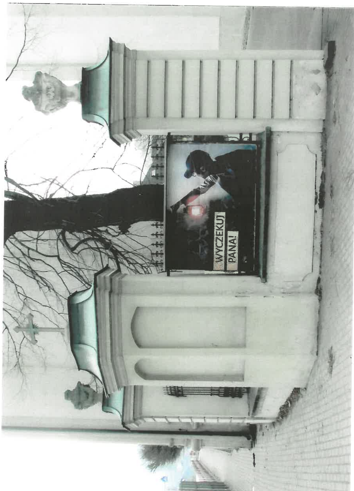
Fot.2 Kościół parafialny p.w. św. Marii Magdaleny w Dukli, II poł. XVIII w. Widok na część ogrodzenia placu kościelnego od strony północnej. Grudzień 2023 r.