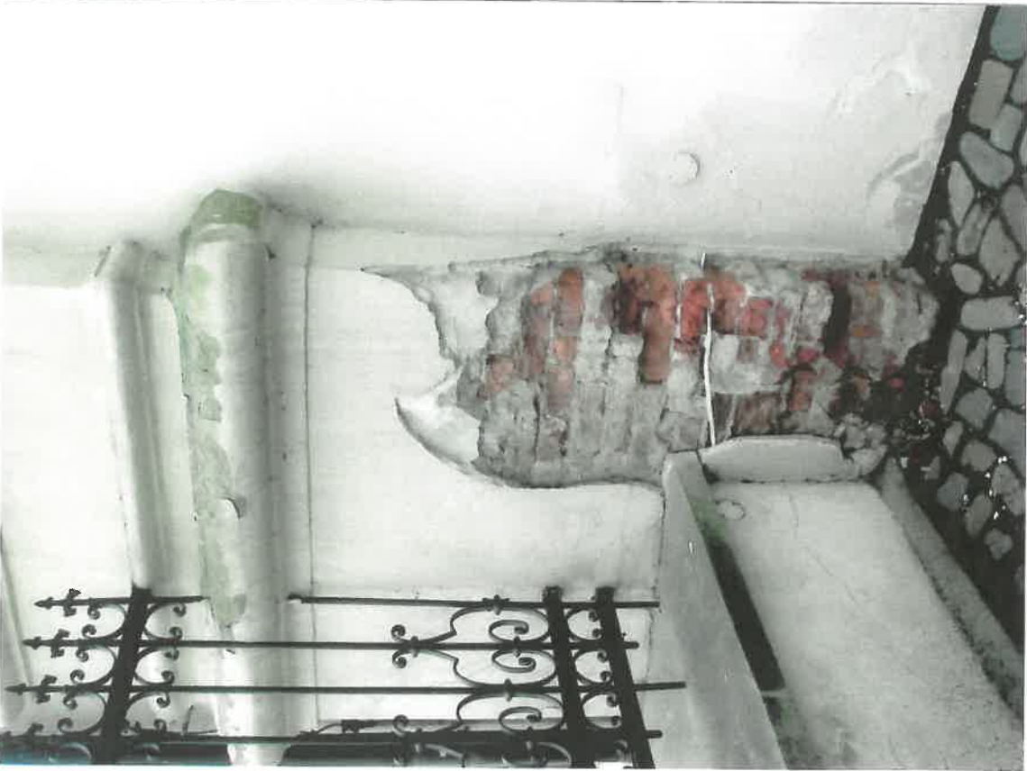
Fot.3 Kościół parafialny p.w. św. Marii Magdaleny w Dukli, II poł. XVIII w. Dolna część pilastra północnej elewacji dzwonnicy. Widoczny duży ubytek tynku i cegieł. Na półtwaiku powyżej, ubytki farby z widocznymi nawarstwieniami mchu. Grudzień 2023 r.